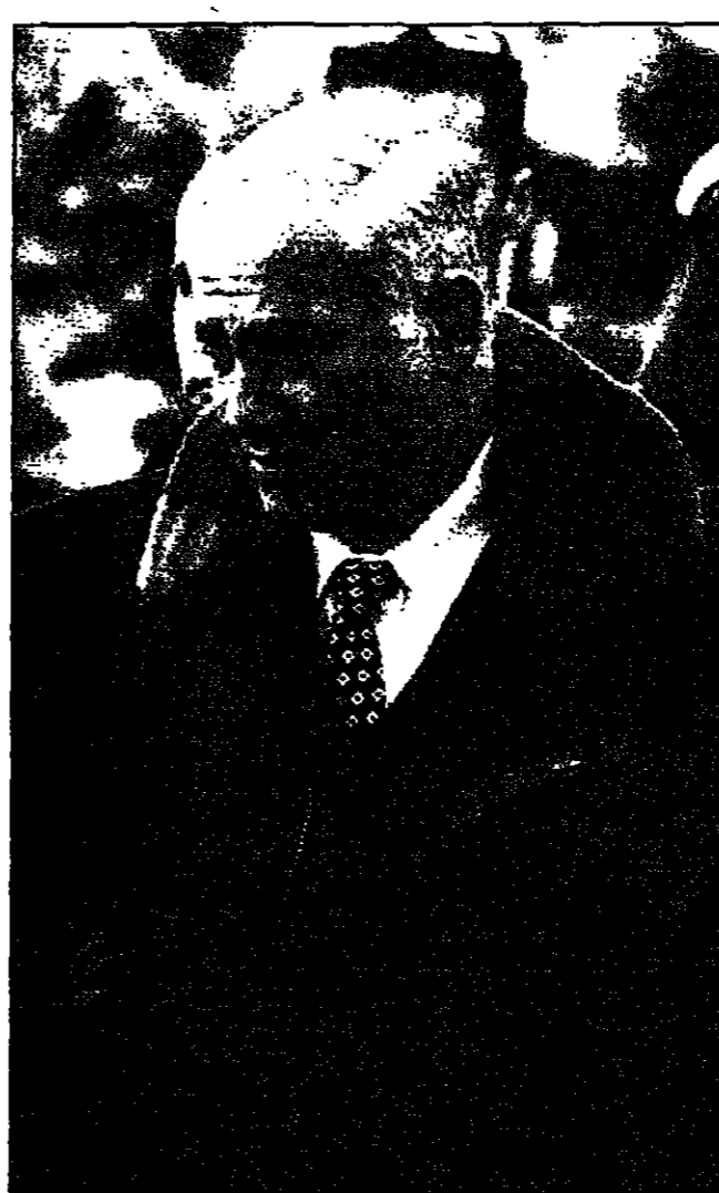
نتنياهو يتفقد مكان الحادث